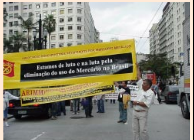
Manifestação em defesa da saúde dos trabalhadores. Em 2006, um exemplo de unidade e um BASTA à ação dos agentes nocivos no trabalho e no meio ambiente.

O mercúrio causa danos irreversíveis ao Sistema Nervoso Central (SNC), provocando alterações na memória, mudanças de comportamento, alternando quadros de ansiedade e depressão, insônia, dores musculares e de cabeça, gengivite crônica, tremores e até a morte. Em São Paulo, um dos casos mais conhecidos ocorreu na fábrica de lâmpadas Sylvania, em 1992, quando mais de uma centena de trabalhadores foram diagnosticados pelo Centro de Referência em Saúde do Trabalhador com intoxicação crônica por mercúrio.