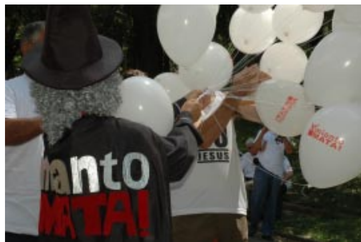
No dia 1º de Maio, a ABREA lançará balões contra o amianto, na Praça da Sé.

Aos movimentos que lutam pelo banimento do amianto e a indenização das vítimas, como a Associação Brasileira dos Expostos ao Amianto (ABREA), não resta, portanto, outra saída que não seja a de promover campanhas de esclarecimento junto ao consumidor destes