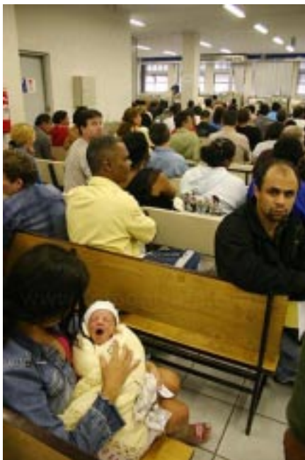
Concurso e contratação de funcionários para melhorar o atendimento

resultado da aplicação das Reformas da Previdência e das medidas de enxugamento de recursos. O governo alega que aumentou muito a quantidade de benefícios por afastamento em virtude de acidentes e adoecimento dos trabalhadores. Por outro lado as condições de trabalho e vida da população tem piorado todos os dias; o sistema