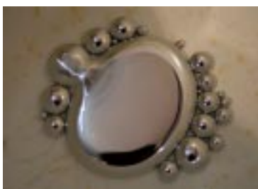
Mercúrio: mal que precisa ser erradicado

problemas para conseguir manter o atendimento e tratamento aos trabalhadores contaminados por mercúrio nos poucos serviços de saúde especializados em diagnosticá-lo e tratá-lo, como é o caso do Centro de Referência em Saúde do Trabalhador e o Serviço de Saúde Ocupacional / Hospital das Clínicas (SSO/HC).