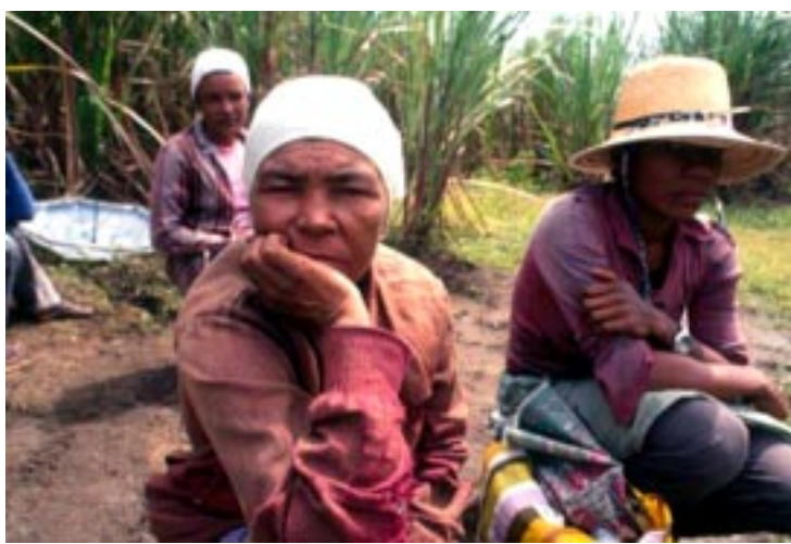
Etanol provocará tragédia ao transformar o Brasil numa grande Roça de cana!

O ritmo do trabalho é alucinante, o pagamento uma merreca e as condições desumanas. Até os jornais que normalmente não estão nem aí pra situação do trabalhador, andam falando sobre isso. Na região de Ribeirão Preto, uma das mais ricas do Brasil, tem acontecido barbaridades. Várias